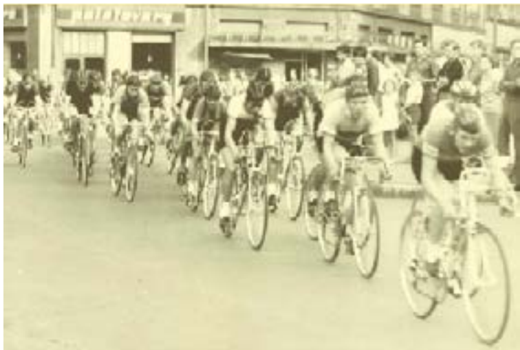
Čelo pelotonu při Velké ceně Hradce Králové v roce 1967.