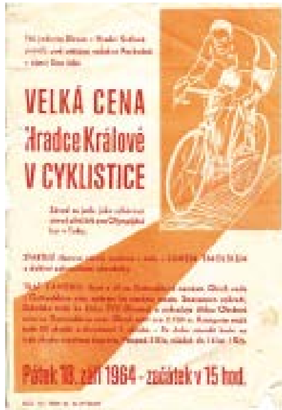
Plakát vytištěný u příležitosti prvního ročníku Velké ceny Hradce Králové v roce 1964.