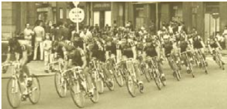
Peloton v průběhu Velké ceny Hradce Králové v roce 1987.