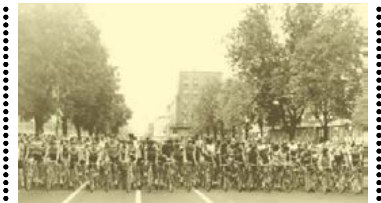
Početný cyklistický peloton na startu Velké ceny Hradce Králové na Gočárově třídě.