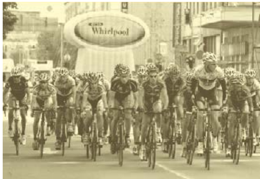
Peloton při Velké ceně Hradce Králové v roce 2009 v okamžiku průjezdu místem startu a cíle závodu na Ulrichově náměstí.