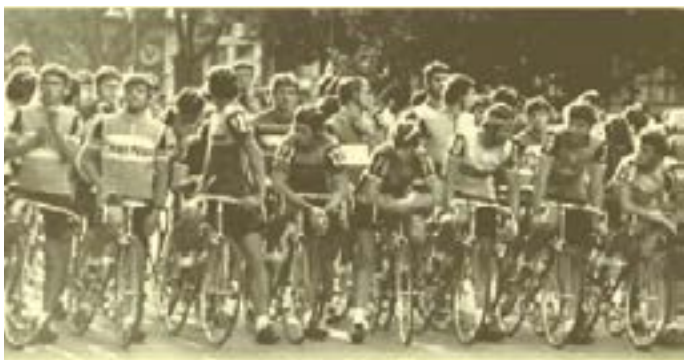
Start Velké ceny Hradce Králové v roce 1984.