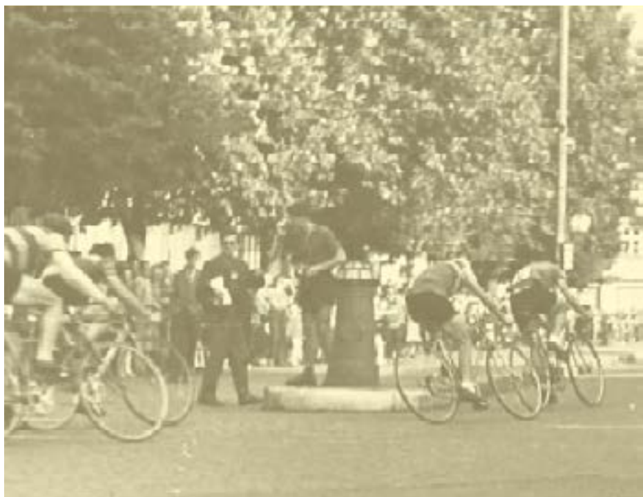
Na historickém snímku vjíždí peloton z Mánesovy ulice na Ulrichovo náměstí.