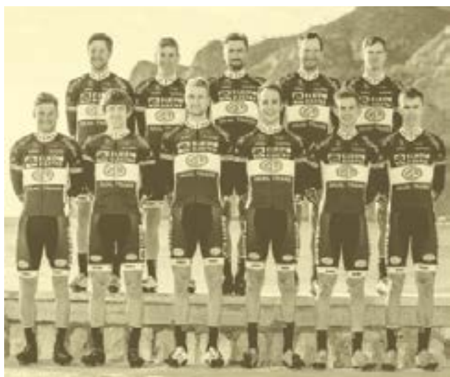
ELKOV AUTHOR CYCLING TEAM HRADEC KRÁLOVÉ 2018