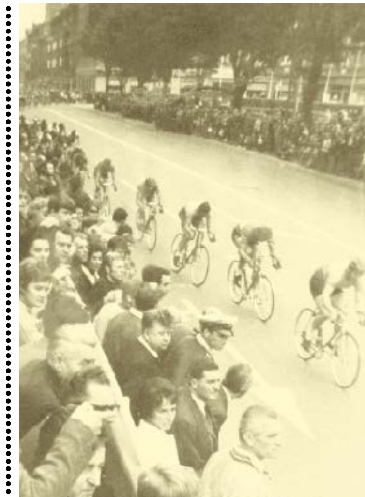
Velká cena Hradce Králové se vždy těšila velké návštěvnosti diváků. Prvním ročníkům jich přihlíželo až 15 tisíc. Cyklistický peloton projíždí po Ulrichově náměstí